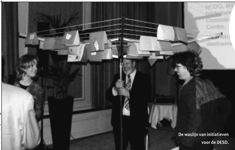
De waslijn van initiatieven voor de DESD.